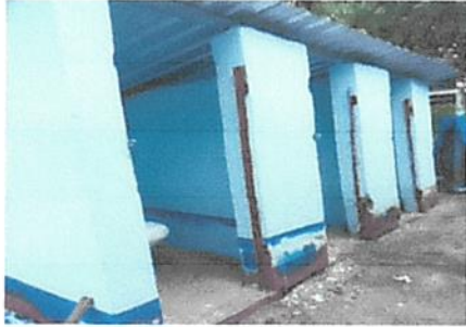
Foto 7: mantenimiento a puertas lijado y aplicación de pintura, lijado y pintado de estructura de baños