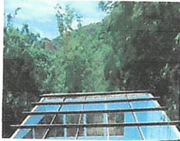
Foto 1: sustitución de lamina normal por lamina troquelada alusin calibre #26